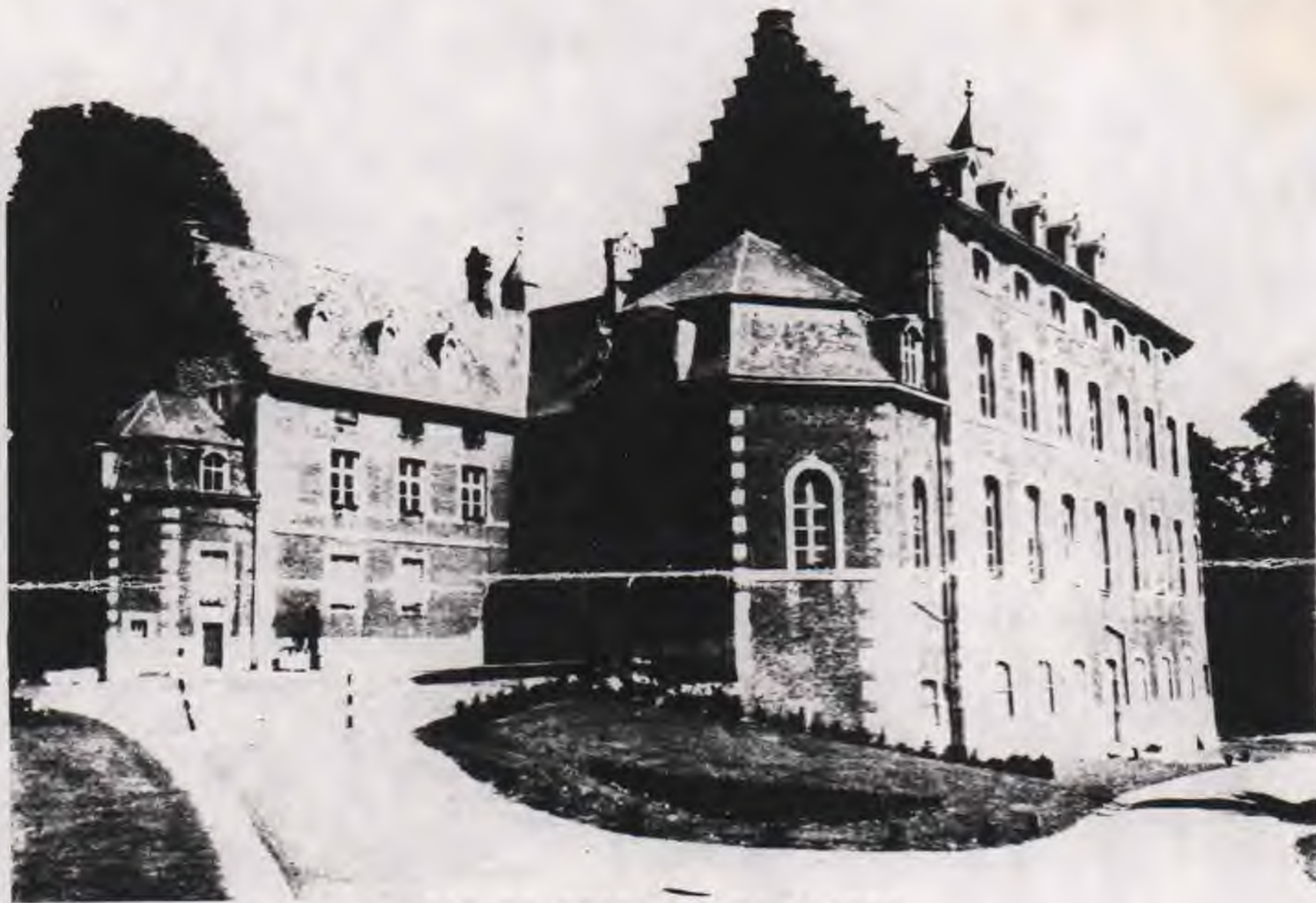
LA KASTELO DE "MONCEAU S/SAMBRE"