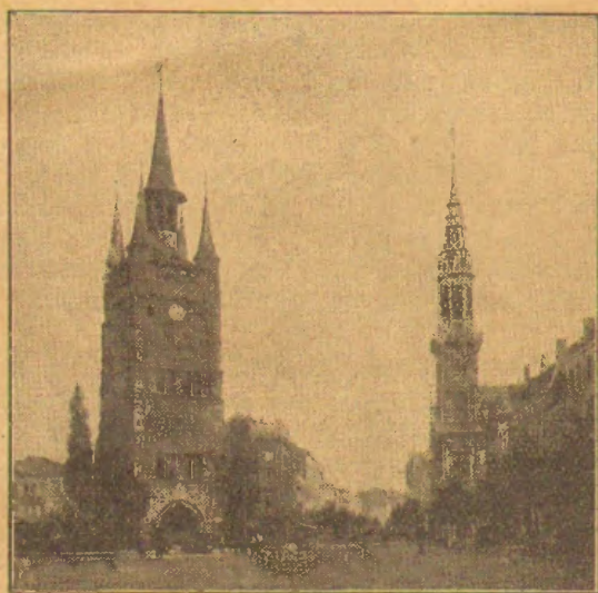
Kortrijk. — Parta vido de la Granda Placo.

Por inde malfermi la kongreson, la programo mencias, sabate vespere, sonorilarkoncerton kun akompano de teabaj trumpetoj. Estas tiaj noktkoncertoj kiuj somere allogas tiom da alilandanoj al Bruĝo kaj Mehleno. Dimanĉmatene okazos diservo kun Esperanta prediko.