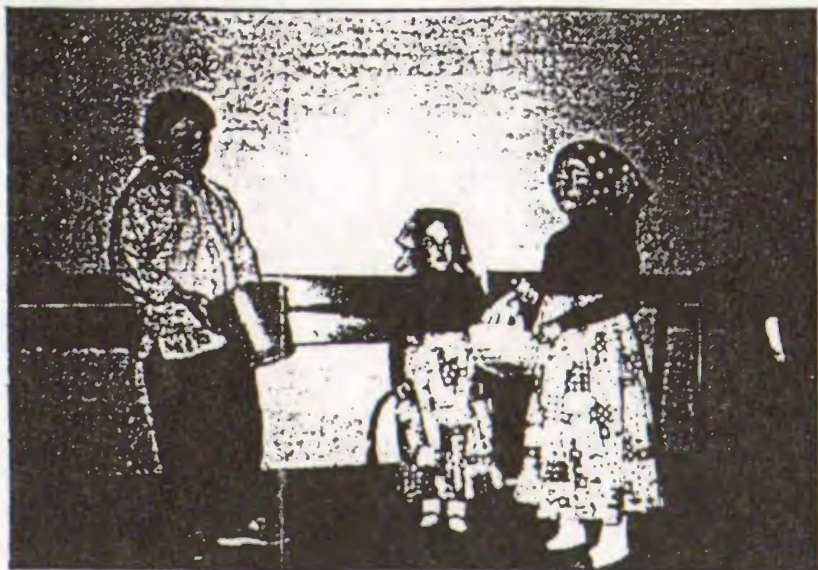
Estas tru' en sitelo... of Er is een gat in mijn emmer