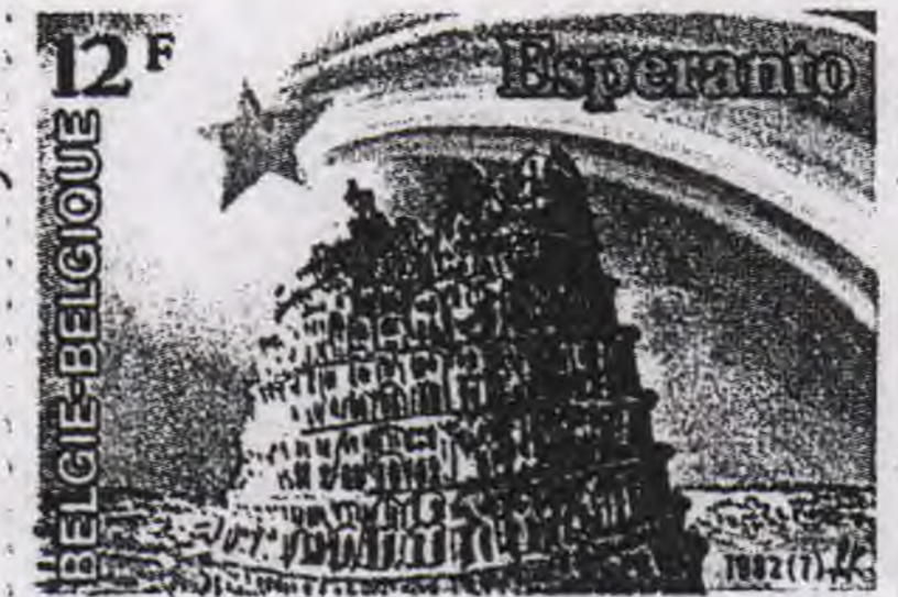
De Toren van Babel en Esperanto op een Belgische postzegel van 1982

nieren in landen zo verschillend als China, Denemarken of Tunesië. Deze eenvoudige taal heeft alle overbodige last vermeden om juist een vlotte communicatie in de hand te werken." De uitgang van een woord duidt meteen op de aard ervan: naamwoord (-o), werkwoord (-i), bijwoord (-e), adjectief (-a). Daarbij één enkele meervoudsvorm, één logische vervoeging zonder onregelmatige werkwoorden.