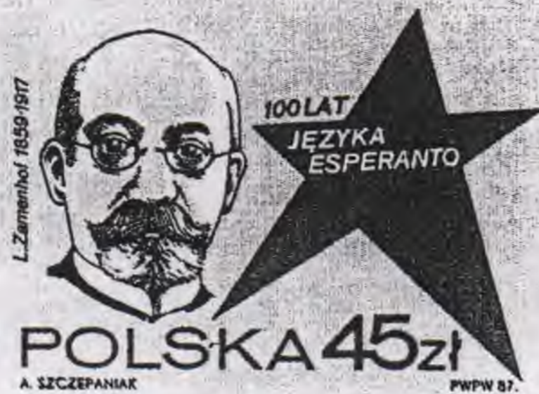
Poolse postzegel voor de 100ste verjaardag van de creatie van Esperanto door Louis Zamenhof