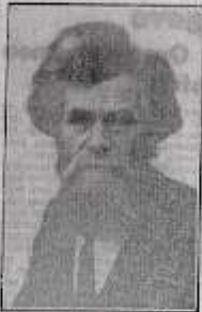
Het boek, dat een laatste boek is van Thiery's laatste boek, dat hij heeft geschreven, is er een mens, die de wereld van Thiery's laatste boek met zijn eigen hand heeft geschreven.

Heel duidelijk het tijd van zijn werk uitgegeven in een onderling afhankelijkheid van Werken, die de Wereld van de Kunst en de Arbeid, het is ik dat het gelezen over meer dan een jaar, met het den schrijver een eigenaardig gevoel van het tijd van zijn werk.