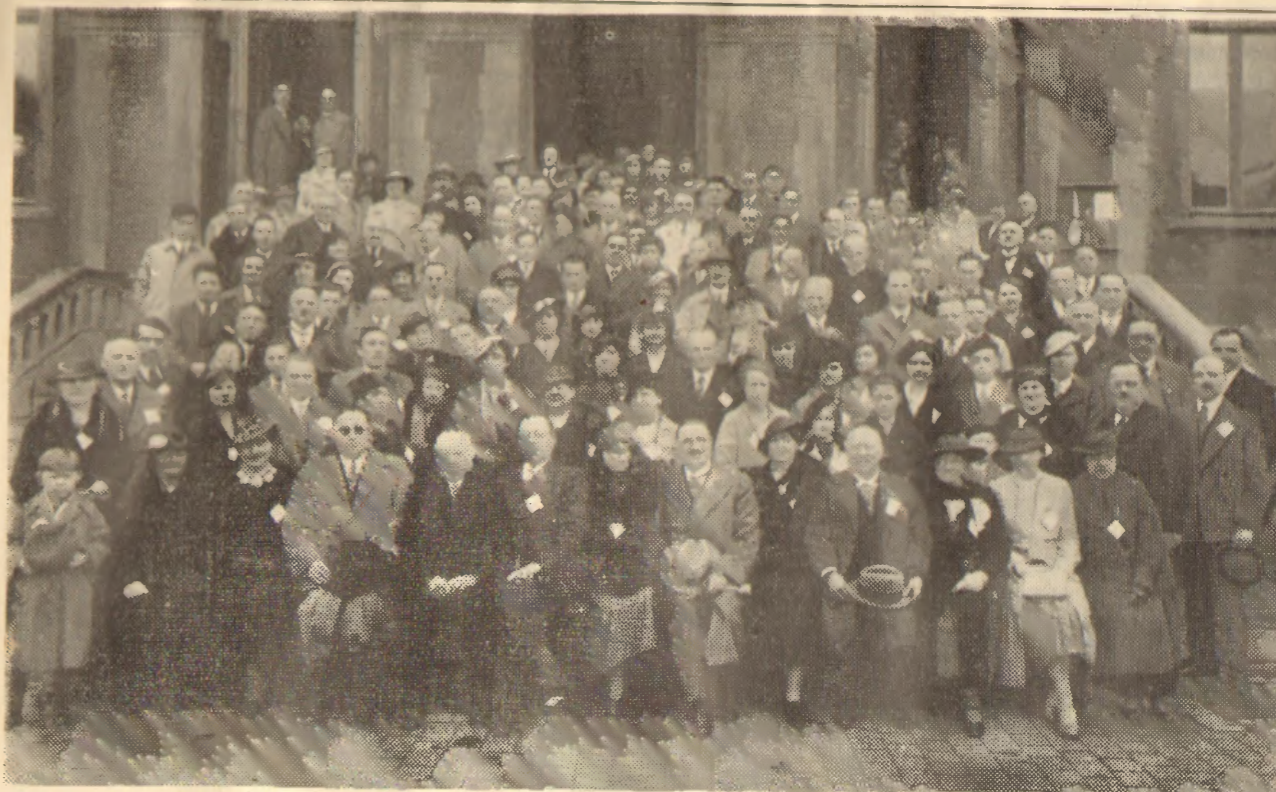
La Kongresanoj antaŭ la urbdomo. — La urbestro sidas meze de la estraro.