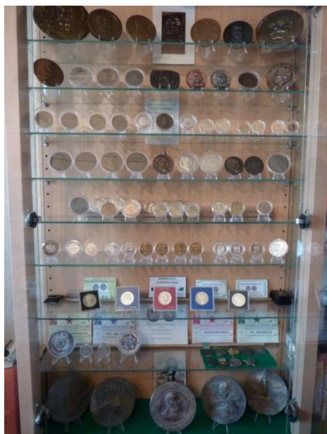
Vitroŝranko kun parto de privata kolekto

Artaj medaloj ne daŭre kuŝu en kestoj, skatoloj aŭ en monkelo. La rilato inter artisto kaj kolektanto estu senĉese varma kaj la kontakto inter artaĵo kaj mano ne tro longe estu interrompita. Se kolektanto volas ĝui impresojn, liaj trezoroj ne kaŝe dormu en tirkestoj. Hejme li instalu propran vitroŝrankon kun facile malfermeblaj pordetoj. Rekomendinde estas ŝranko kun spigulo kiel fono. Tiel sufiĉas montri nur unu ekzempleron de ĉiu tipo aŭ varianto. Se eble, li almenaŭ unu fojon partoprenu en numismatika ekspozicio.