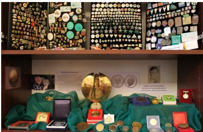
Numismatika ekspozicio en la Esperanto-muzeo de Svitavy

Medaloj estas kolektataj, ĉar ili estas kolektindaj. Kolekti estas kunigi objektojn kaj eventuale ordigi ilin. Kolektado estas ŝatokupo, ne malofte ankaŭ investado. La kolektant(in)o celkonscie serĉadas tiujn medalojn, kiuj emocie vibrigas ŝin aŭ lin. Evidente, medalo ne elvokas samspecajn emociojn ĉe diversaj personoj, sed tamen la resonado inter medalo kaj medalkolektanto estas esenca. Ĝi funkcias kiel perilo inter artisto kaj kolektanto. Estiĝas dialogo per signoj, alivorte per ikone sendata mesaĝo. La emocio klare superregas la rilaton kaj gajigas la kolektanton, vekas neordinaran, varman senton. Ju pli universala la mesaĝo de la medalo, des pli homoj entuziasmiĝas, eĉ trans multaj epokoj kaj jarcentoj. Tial artaĵoj el la antikva epoko eĉ nun povas kortuŝi nin. Same evidente en la medalarto!