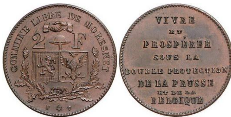
Provaĵo en kupro (aŭ bronzo)

Malgraŭ la promesitaj libereco kaj sendependeco de Moresnet, la moneroj nur mallonge cirkulis. Ili nek ricevis oficialan aprobon, nek havis oficialan valoron. La oficialaj pagiloj en Moresnet senĉese estis belgaj kaj ĉefe germanaj. Tio ankaŭ koncernas la tiamajn amikejajn poŝtmarkojn, pri kiuj raportis nia Elda Doerfler en “La Verda Lupeo” de ELF-Arek.