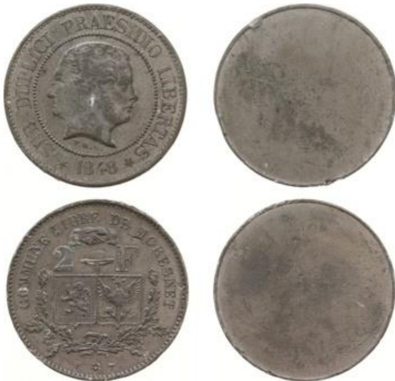
Unuflankaj provaĵoj en plumbo