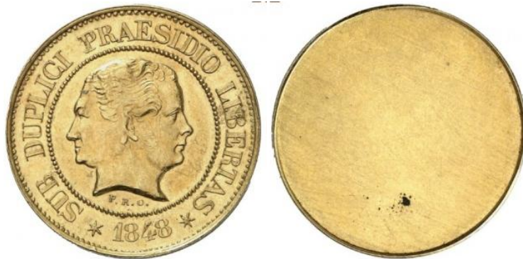
Unuflanka provaĵo en oro

La eldonkvantoj estas nekonataj. Krom la tri tipoj en arĝento, ekzistas multaj variantoj (provaĵoj) en oro, arĝento, bronzo, kupro, stano kaj eĉ plumbo. Mankas tamen variantoj en zinko, la fama metalo el la minejo de Moresnet! En la revuo "Numismatica Herentals", n-ro.86 de okt. 2011, Frank Lippens en sia artikolo "Numismatiek van Moresnet" mencias ne malpli ol 35 variantojn!