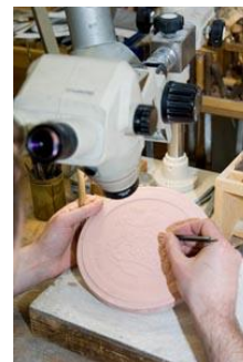
Gravurado en gipson