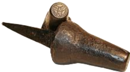
Laŭ tekniko de rekta gravuro

La plej malfacila, plej malnova tekniko estas la gravurado en ŝtalan stampilon, kiu poste estas malmoligata kaj uzata. (Vidu ankaŭ rubrikon “MEDALISTOJ”)