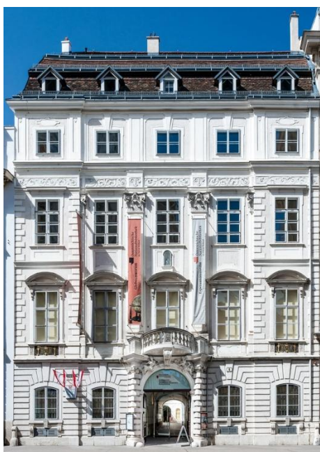
Palais Mollard, Wien, Herrengasse 9

En 2016 rekorda nombro de 15.937 personoj vizitis la Esperantomuzeon en Vieno. Kompare kun la jaro 2015 (13.396) tio estas rimarkinda 18,97-elcenta kresko. Se oni konsideras, ke la Esperantomuzeo nur disponas pri spaco de 80m 2 , la statistiko estas elstara: ekde 2005, kiam la nova ekspozicio en Herrengasse 9 estis inaŭgurita, vizitis pli ol 110.000 personoj la Esperantomuzeon, okazis pli ol 700 gvidadoj kaj pli ol 350 Esperanto-fulmkursoj (regule nur ekde la jaro 2009), kiujn partoprenis entute pli ol 7.000 personoj.