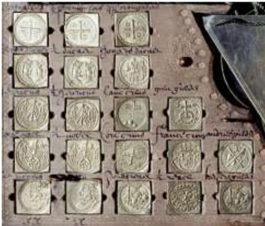
Zelanda monerpezilo el 1622