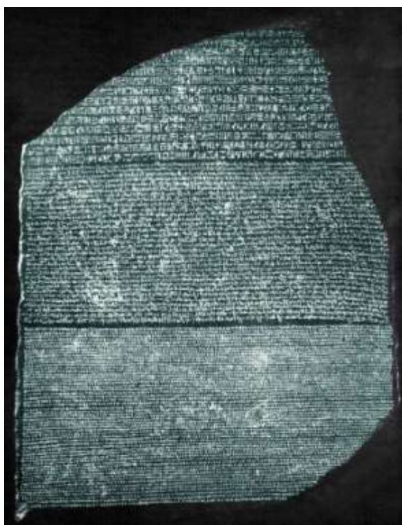
La Ŝtono de Roseto