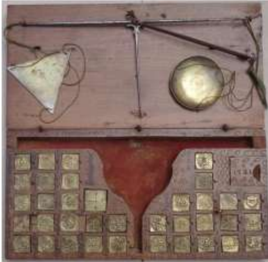
Skatolo monerpezila el 1581