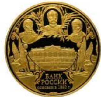
ora 5 kg- monero

Ambaŭ moneroj estas produktitaj el oro je 999%. Maso estas 5 kilogramojn! Ĝenerala maso estas 5035 gramojn.