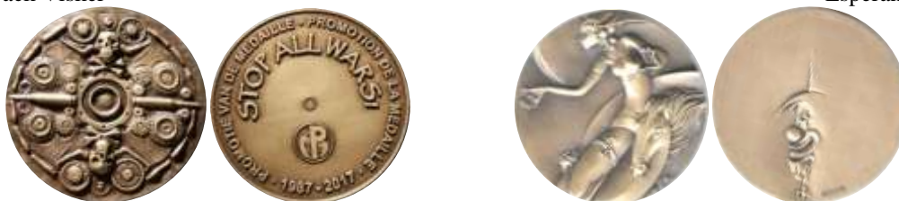
Du el multaj pormembraĵaj jarmedaloj faritaj de Mauquoy por “Promotie van de Medaille”