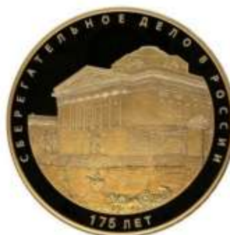
50 000 rubloj