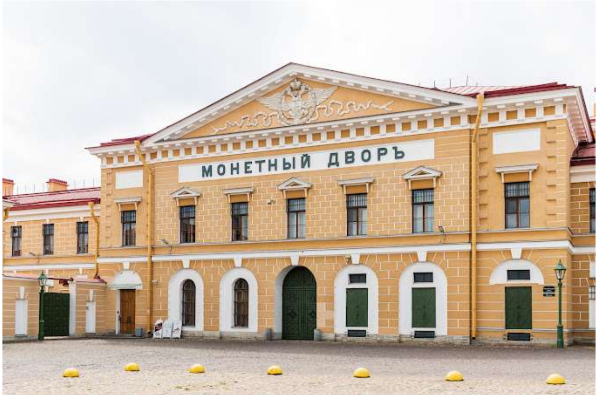
Monera korto en Sankt-Peterburgo

La plej grandaj oraj moneroj en Rusio havas nominalvaloron je 50 000 rubloj. Estas du: