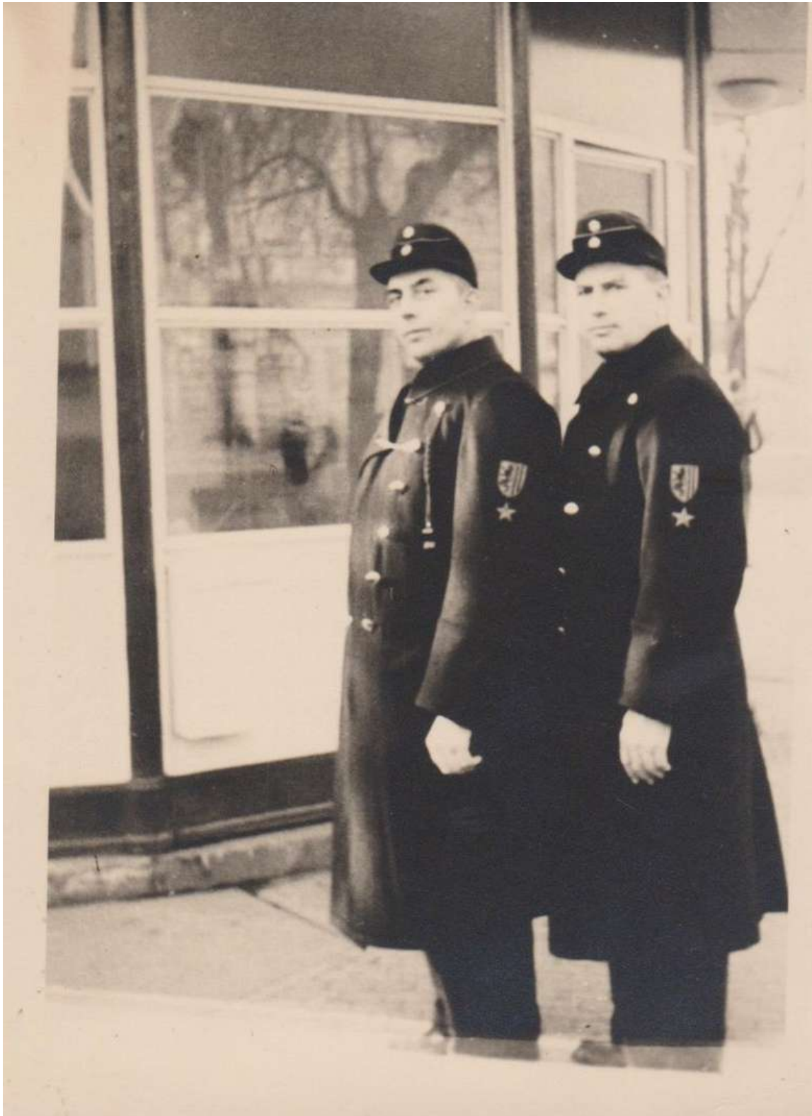
Esperantistoj-tramistoj en Dreseno en 1948