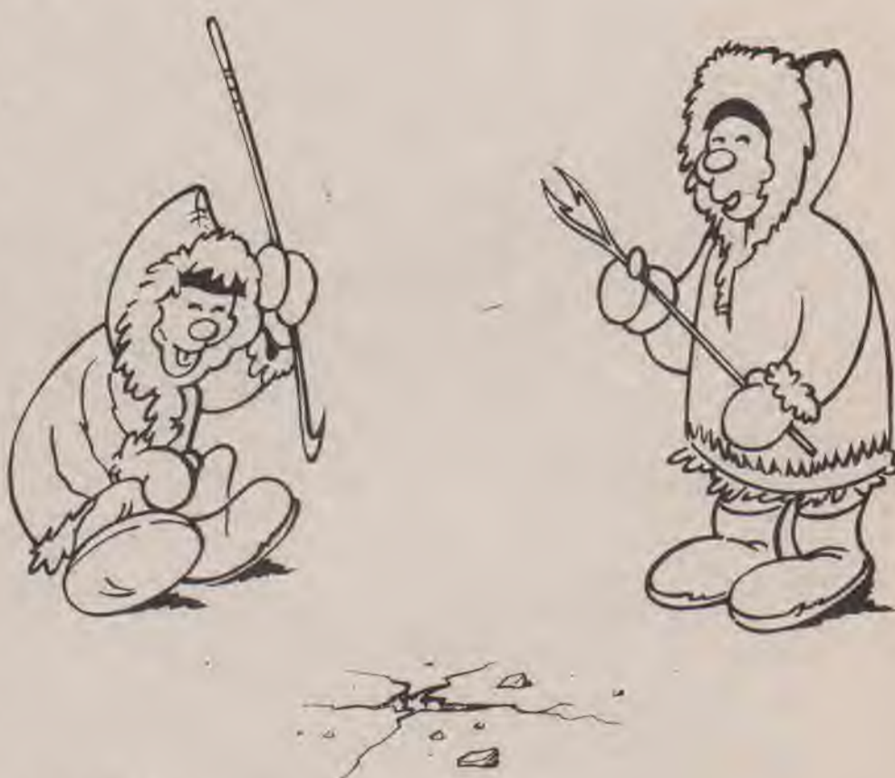
Zi for for.

Dertig jaar geleden bezocht ik hem persoonlijk in zijn appartement in Brussel. Hij kende Esperanto, het was zijn uitgangspunt, de basistreken ervan had hij dan ook overgenomen. Hij had echter kritiek op samengestelde woorden als „grandegulo” (reus) en „malgrandegulo” (dwerg), maar wist blijkbaar niet dat wij ook toen reeds de woorden „giganto” en „nano” gebruikten. Zijn grootste bezwaar