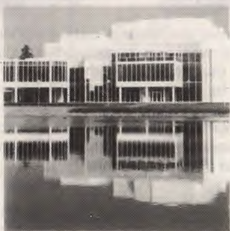
Het Congresgebouw in Tampere ontvangt in juli 1995 duizenden esperantisten uit alle delen van de wereld.