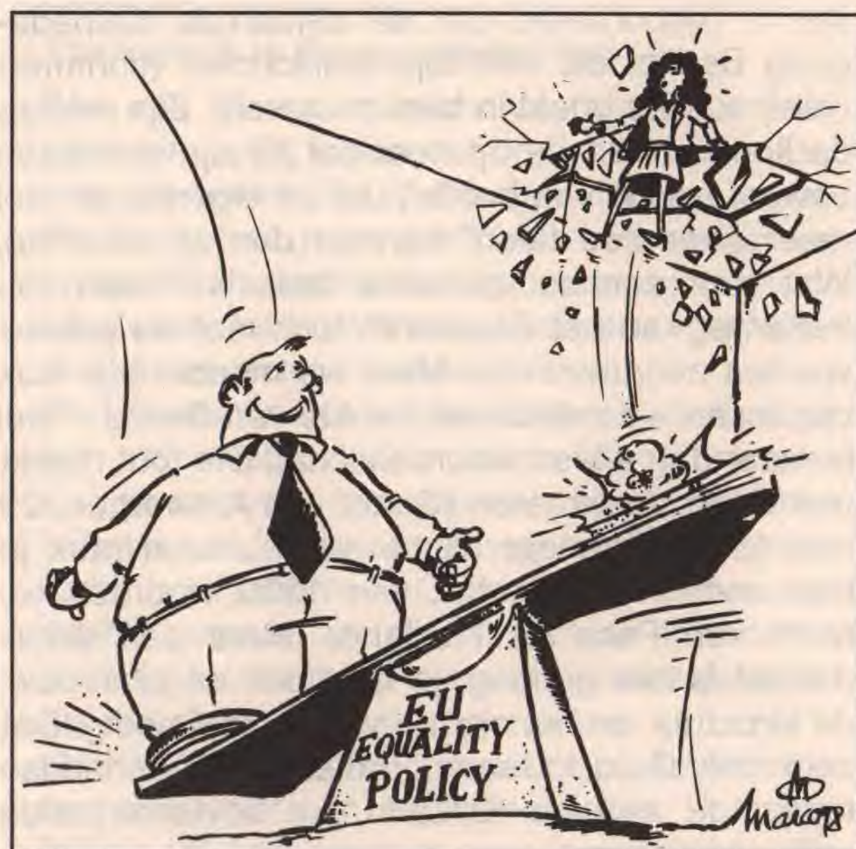
De gelijke kansen politiek van Europa: vrouwen en kleine talen maken evenveel kans.

De vooroordelen die het meest blijken te geven van de onbekendheid met het Esperanto, is dat de taal enerzijds moeilijk zou zijn en anderzijds (te) Indo-Europees. Daarom is het geen aanvaardbare oplossing en ondemocratisch. Nu kan men niet ontkennen dat het Esperanto van Europese oorsprong is, en dus is het voor sprekers van het Arabisch, de talrijke Afrikaanse talen of van Aziatische talen relatief moeilijker te leren. Maar het is dan toch weer onnoemelijk veel gemakkelijker dan het nu toegepaste alternatief (het Engels). Daarenboven heeft het Esperanto tal van aspecten