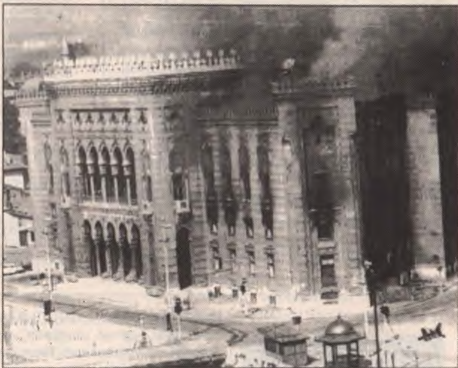
De Bosnische nationale en universitaire bibliotheek: gevaarlijk militair doelwit: ruim 3 miljoen boeken gingen in vlammen op.

Diezelfde motivatie ligt ook aan de grondslag van het overaccentueren van de kwaliteit van de culturele prestaties: tentoonstellingen, concerten, boeken... het behoort allemaal tot de toppen van de kunst... een overappreciatie die ook esperantosprekers niet helemaal vreemd is. Een appre-