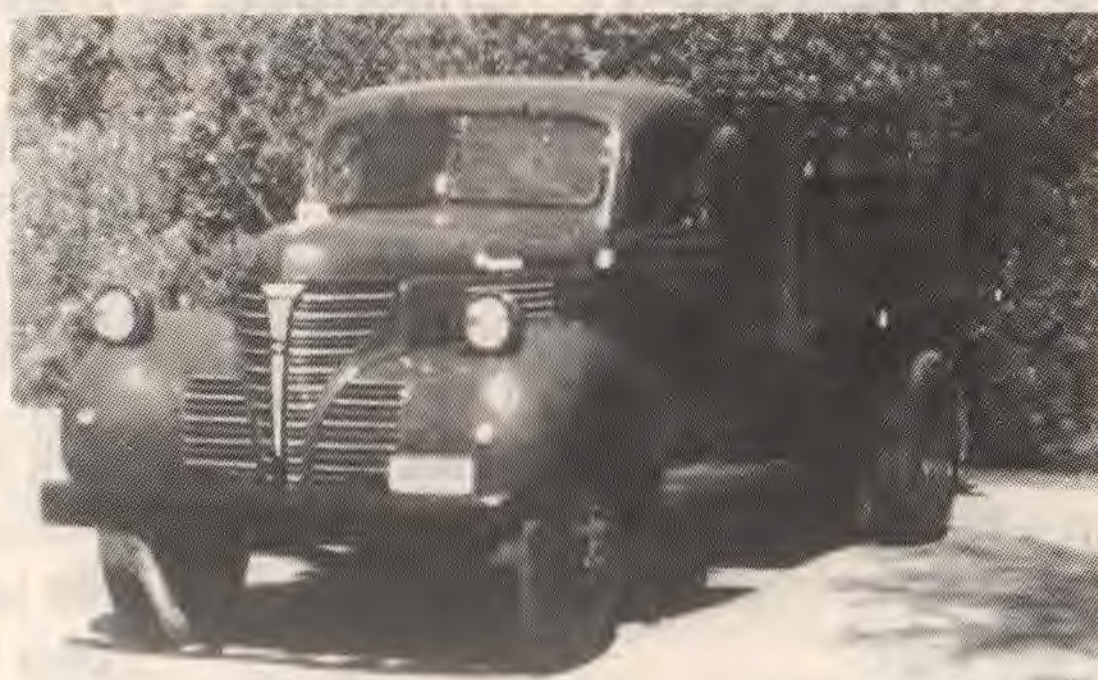
Dringend aan vervanging toe!

Zoals gezegd is de maker van Esperantor I uitgegaan van de lijst Esperanto-Nederlands waarin samenstellingen als malrapida, malbela niet als ingang zijn opgenomen. De neologistische tegenhangers van deze woorden ( lanta en hida ) echter