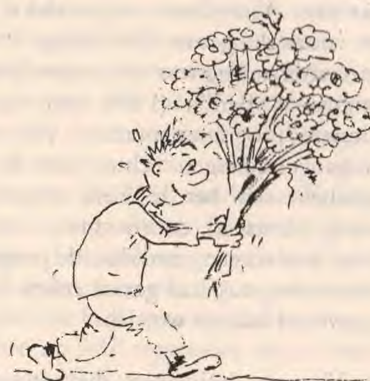
... en verdient ... een bloempje!