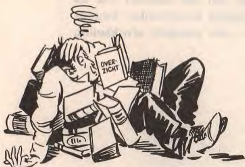
Het oude bestuur is uitgeteld...

lang in het bestuur een spilfunctie heeft bekleed en vreest voor verstarring. Daarom wil ook hij zich in 2001 uit het bestuur terugtrekken. Naast de voorzitter moet er dus ook een nieuwe secretaris worden gevonden. De Algemene Vergadering kiest eigenlijk alleen een voorzitter en een bestuur. Daarna worden de bestuurstaken door de gekozenen zelf onderling verdeeld en toegewezen.