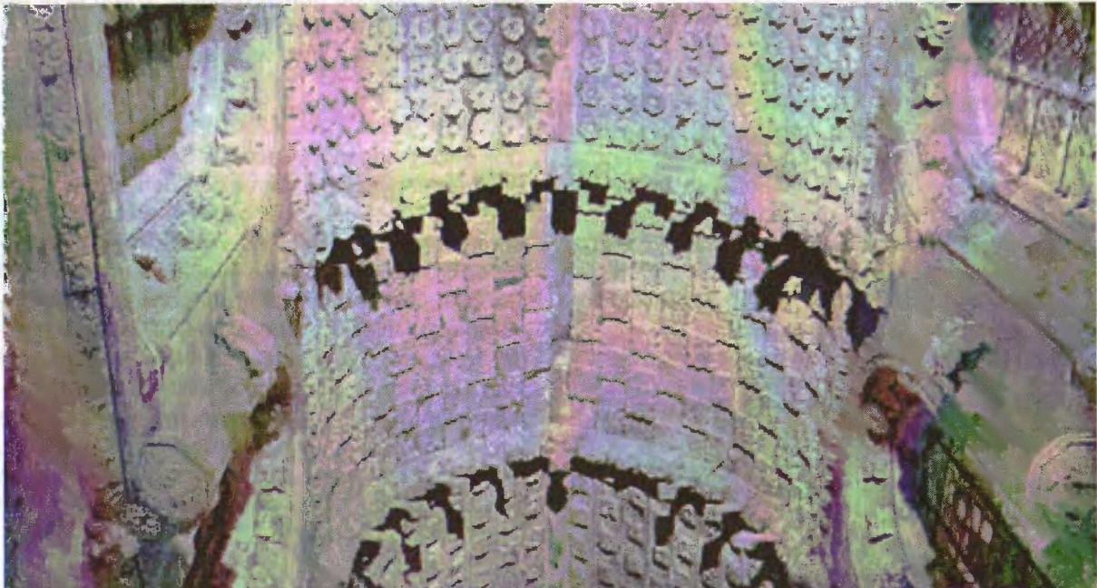
De eerste dag bezochten we Roslyn Chapel, een kapel uit de 16e eeuw, met wondermooi beeldhouwwerk.