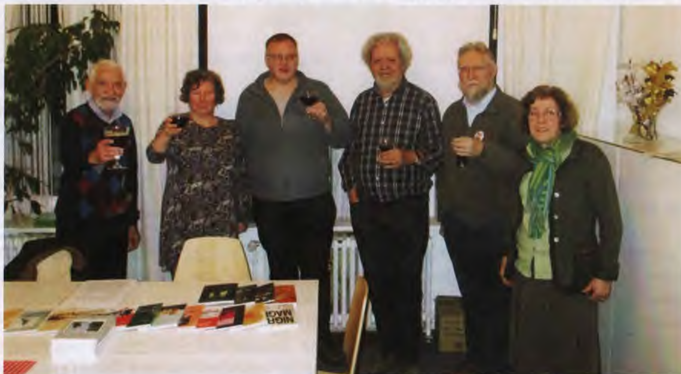
Het bestuur van LVS

Je kan uiteraard informatie bekomen, suggesties doen of bedenkingen formuleren. Stuur je voorstellen in verband met de nieuwe locatie naar strug@skynet.be en de overige naar ivo.durwael@telenet.be .